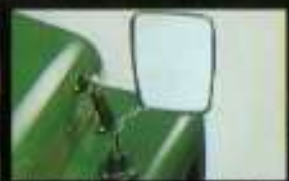
■広い視界も確保できるファンタジーカラー