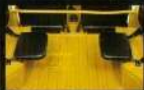
■高質カシミアの厚手、後部シートもU200の厚みが使えます。 (選、メタルアムイフ)