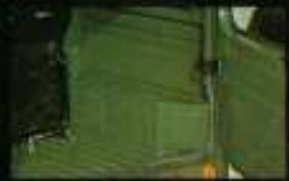
■足踏もゆまゆまの安定、林道車は200kg(パンタグラフ)