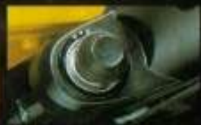
■使いやす、ワイパー、ウインドウウォッシャー

ジムニー53の装備には、驚きのゆまゆまがまわってありません。運転のしやすい大径ステアリング、行動半径を拓ける40リットル大型ガソリンタンク、快適なシートクッション、各種安全装備。使いやすく、安全性も追求した燃費本位の設計です。 ※ウジウジはオプション