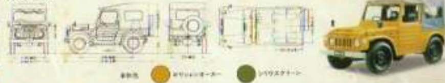
軽タイプ ●ボディカラー ●ボディカラー ●ボディカラー