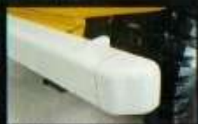
■安全色が美しい耐しり耐擦カラー