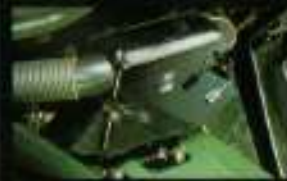
■60リットルの大容量のタンク、燃料補給も便利です。