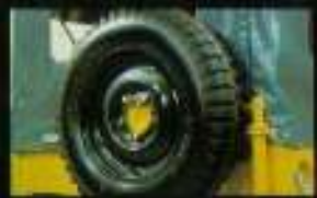
■足踏のらくらくなステップ、コーの時は足踏からの衝撃も減らせます。