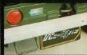
■車体部分のゆまゆまのメタルアムイフ各種仕様、選べた入付アムイフ