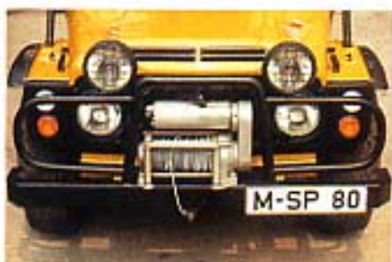
Frontpartie mit Anbauten