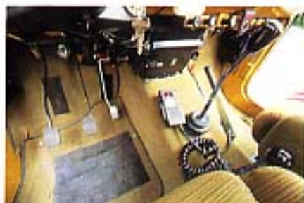
Teppichboden, passend zu den Sitzen