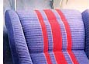
Schalensitze in Cordvelour, blau