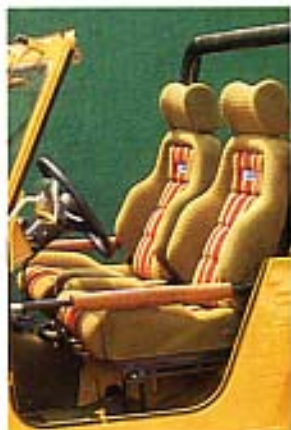
Schalensitze in Cordvelour, gelb