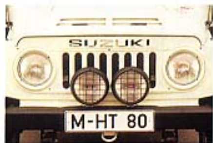
Zusatzscheinwerfer mit Schutzgitter