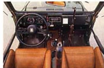
Schalensitze in Kunstleder