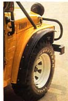
Radausschnitt mit Spezial-Felgen und Reifen