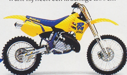
Ook een Giant Off the Road Suzuki : De Suzuki RM 250.

Of de Van, Van de Luxe en Commercial de Luxe, die weer het voordeel hebben van een grijs ken- teken. Paradepaard is de Cabrio de Luxe. U moet 'm gezien hebben om erover te kunnen oordelen.